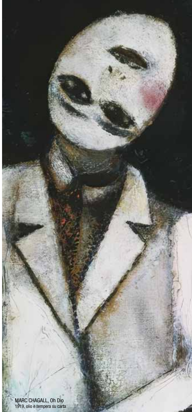
MARC CHAGALL, Oh Dio 1919, olio e tempera su carta

Formazione sincrona , in presenza e online (ZOOM)